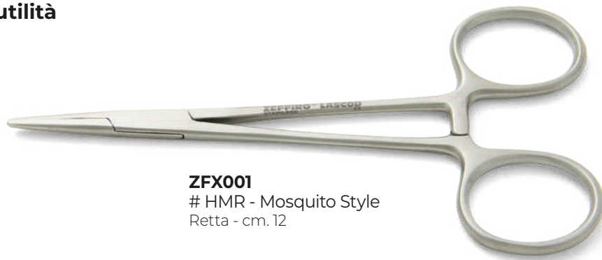
ZFX001 # HMR - Mosquito Style Retta - cm. 12