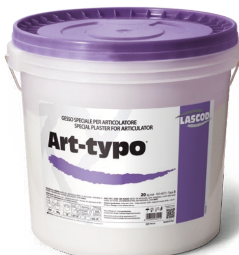
TRT220 - Tipo 3 (20 Kg)