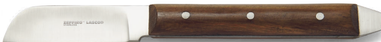
ZLB002 - # GR - Coltello per gesso - Grittman - cm 17