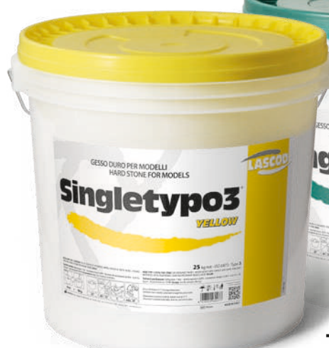
TGI325 - Yellow TGV325 - Green (25 Kg)