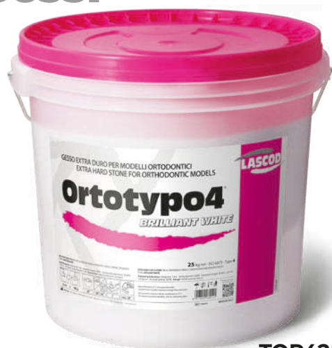
TOR425 - Brilliant White (25 Kg)