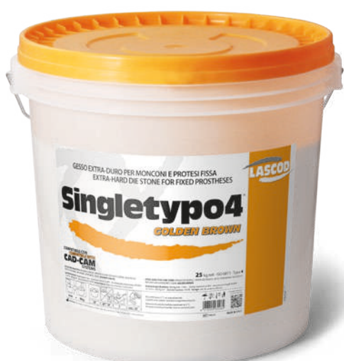
TXE425 - Golden Brown (25 Kg)