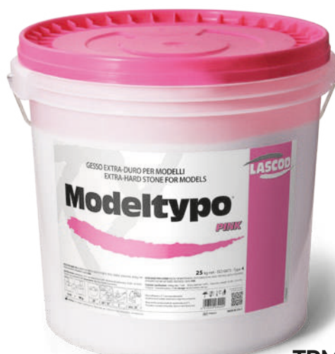
TPM425 - Pink - Tipo 4 (25 Kg)