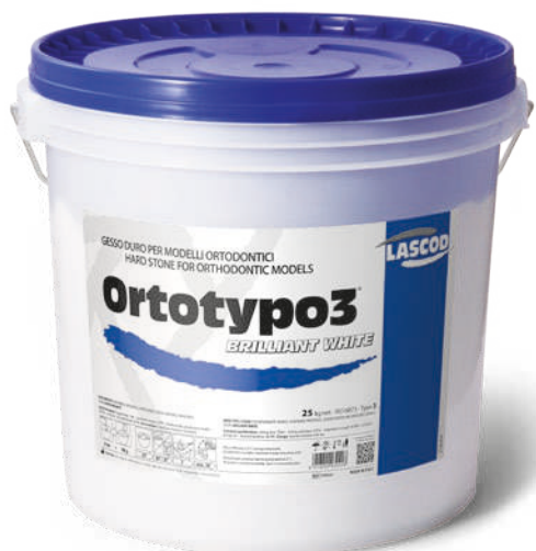
TOR325 - Brilliant White (25 Kg)